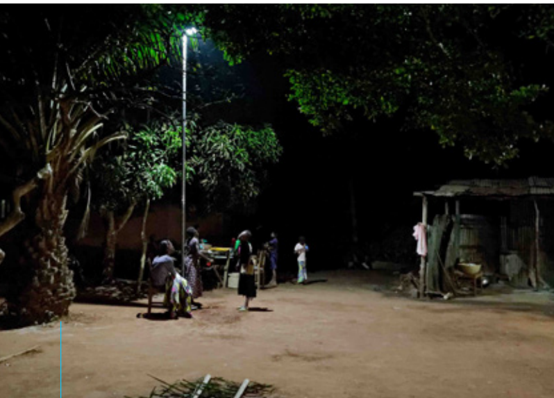
Eclairage dans la cour d'un orphelinat au Bénin